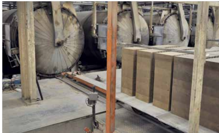
Autoclaaf met recyclingblokken

BRBS Recycling is de branchevereniging voor de recycling-industrie in Nederland. De leden bewerken bouw- en sloopafval, bedrijfsafval, grof huishoudelijk afval en fijn huishoudelijk afval tot nieuwe grondstoffen.