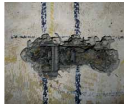
Twee vrijgemaakte voorspanstrengen op 230 mm diepte.