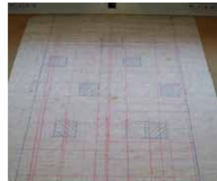
Rode lijnen: locatie wapening, blauwe lijnen: zijkant vloerbalk, blauwe vierkanten: locatie om VZA vrij te stralen.

Voor het bepalen van een eventuele breuk zijn de voorspanstrengen met