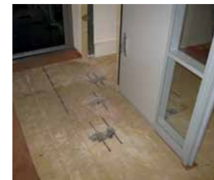
Overzicht van de vrijgemaakte locatie aan het uiteinde van een vloerbalk.