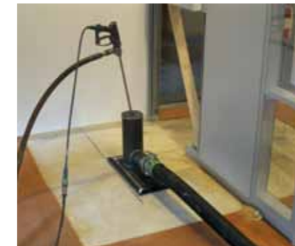
Opstelling voor het middels hoge druk water spuiten, vrijmaken van de voorspanstrengen.