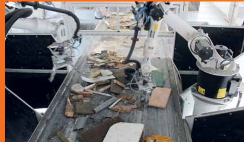
Boven: kunstgrasrecycling, onder: robotisering