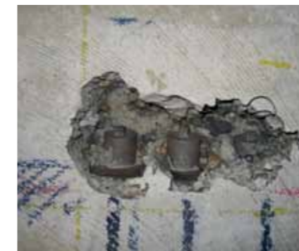
Vrijgemaakte ankerplaat op 90 mm diepte.

Door de alternatieve wijze van uitvoering van het onderzoek is de destructieve schade aan de constructie zeer beperkt en kon de staat van de voorspanstrengen in de vloer toch goed worden beoordeeld.